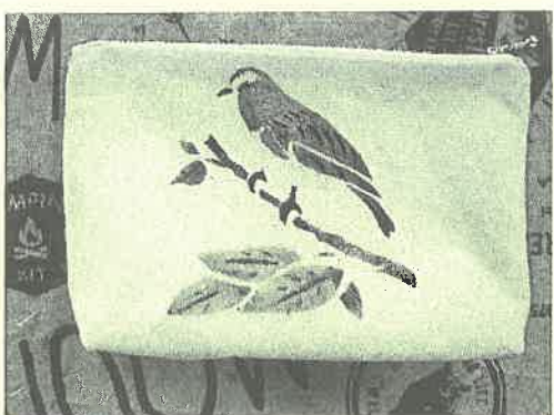
昨年の教室で参加者の作品