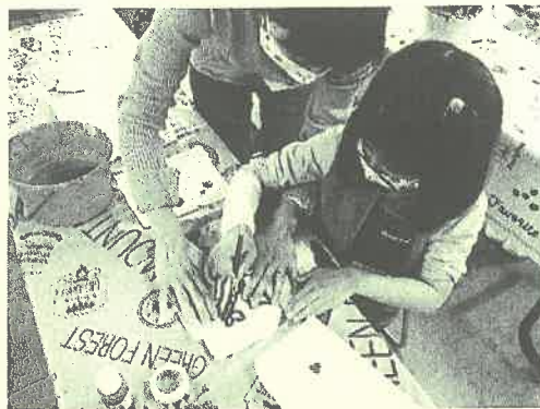
親子で協力して制作している様子