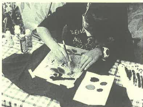
ステンシルを行う参加者の様子